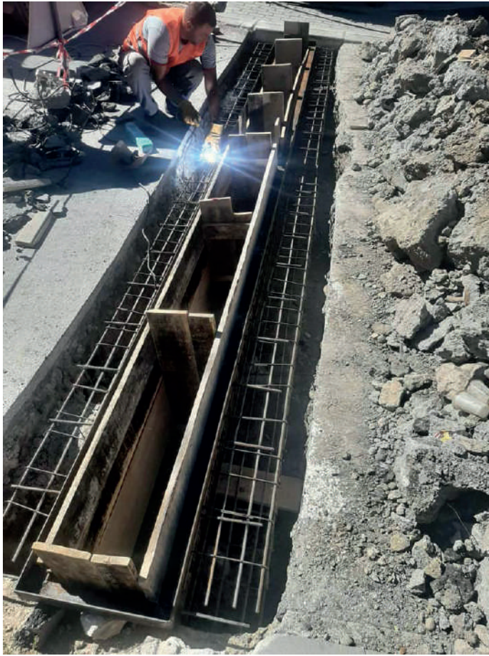
САНИРАЊЕ НА СЛИВНА РЕШЕТКА НА УЛИЦА КИРО КРСТЕВ НА СПОЈ СО УЛИЦА ДИМЧЕ МИРЧЕВ.

ПОДГОТОВКИ ЗА АСФАЛТИРАЊЕ НА УЛ. „ЗАПАДЕН БУЛЕВАР“ КОЈА Е ВО РАМКИ НА „ПРОЕКТОТ ЗА ПОВРЗУВАЊЕ НА ЛОКАЛНИ ПАТИШТА“. ИСТАТА Е ВО ДОЛЖИНА ОД 609 М. И ОПФАТЕНИ СЕ ДВЕТЕ КОЛОВОЗНИ ЛЕНТИ .