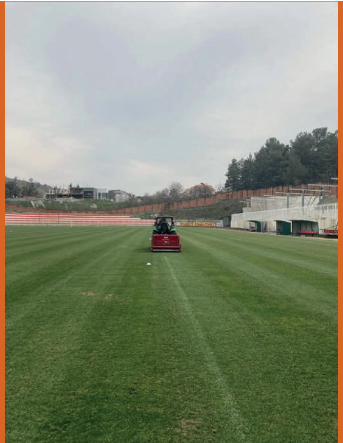
РЕДОВНО ГОДИШНО ОБНОВУВАЊЕ НА ЗЕЛЕНАТА ПОВРШИНА НА ГРАДСКИ СТАДИОН „ТИКВЕШ“