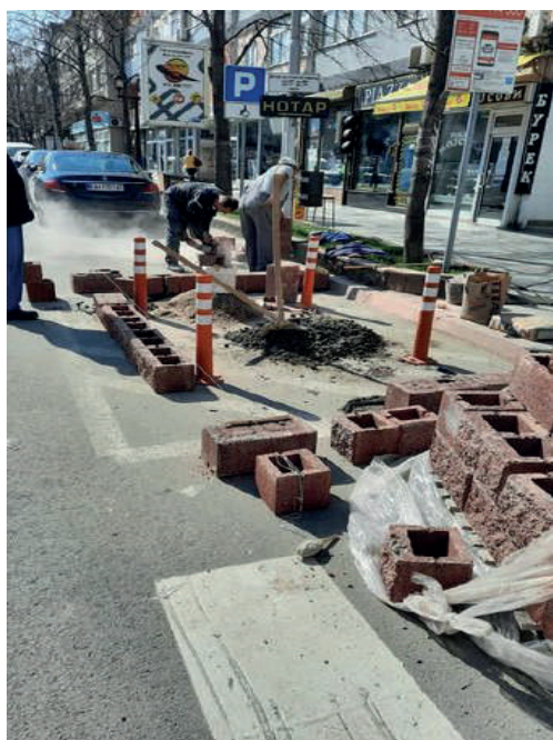
ЗАПОЧНА ИЗГРАДБАТА НА ЗЕЛЕНИ ОСТРОВИ НА УЛИЦАТА „ИЛИНДЕНСКА“, КОИ СЕ ДЕЛ ОД ПРОГРАМАТА ЗА ПОДОБРА ЖИВОТНА СРЕДИНА НА ОПШТИНА КАВАДАРЦИ. НА ВКУПНО 15 ОСТРОВИ ЌЕ БИДАТ ПОСАДЕНИ ЦВЕЌЕ И НИСКИ ЗИМЗЕЛЕНИ ДЕКОРАТИВНИ САДНИЦИ