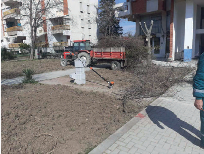
УРЕДУВАЊЕ НА СТАРИ И НОВИ ПОВРШНИ НА ЗЕЛЕНИЛО ВО НОВИОТ ЦЕНТАР