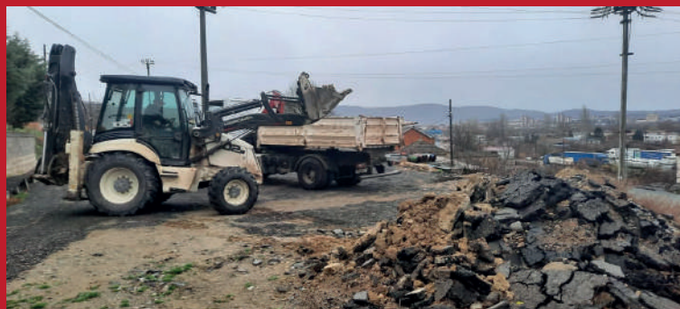
ЧИСТЕЊЕ НА ДИВА ДЕПОНИЈА ВО СЕЛО МАРЕНА