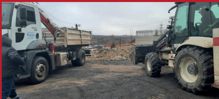
ЧИСТЕЊЕ НА ДИВА ДЕПОНИЈА ВО НАСЕЛБА ГЛИШИЌ