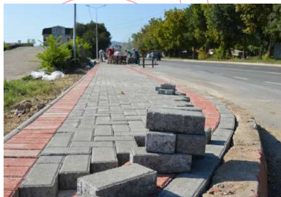
Поплочување на тротоари на Западен булевар