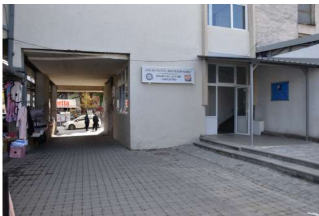
Нов влез во административната зграда на Домот на Култура