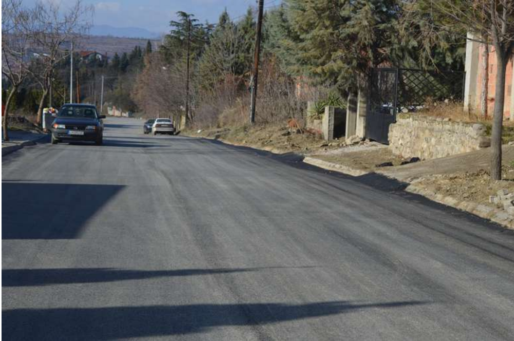
Асфалтирање на ул. Дисанска