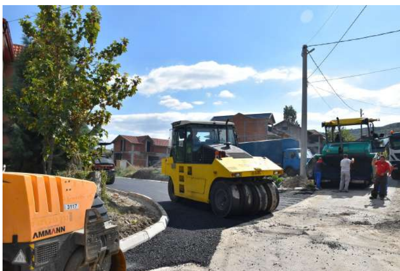
Асфалтирање на ул. Јован Планински спој со ул. Ѓоре Брушански