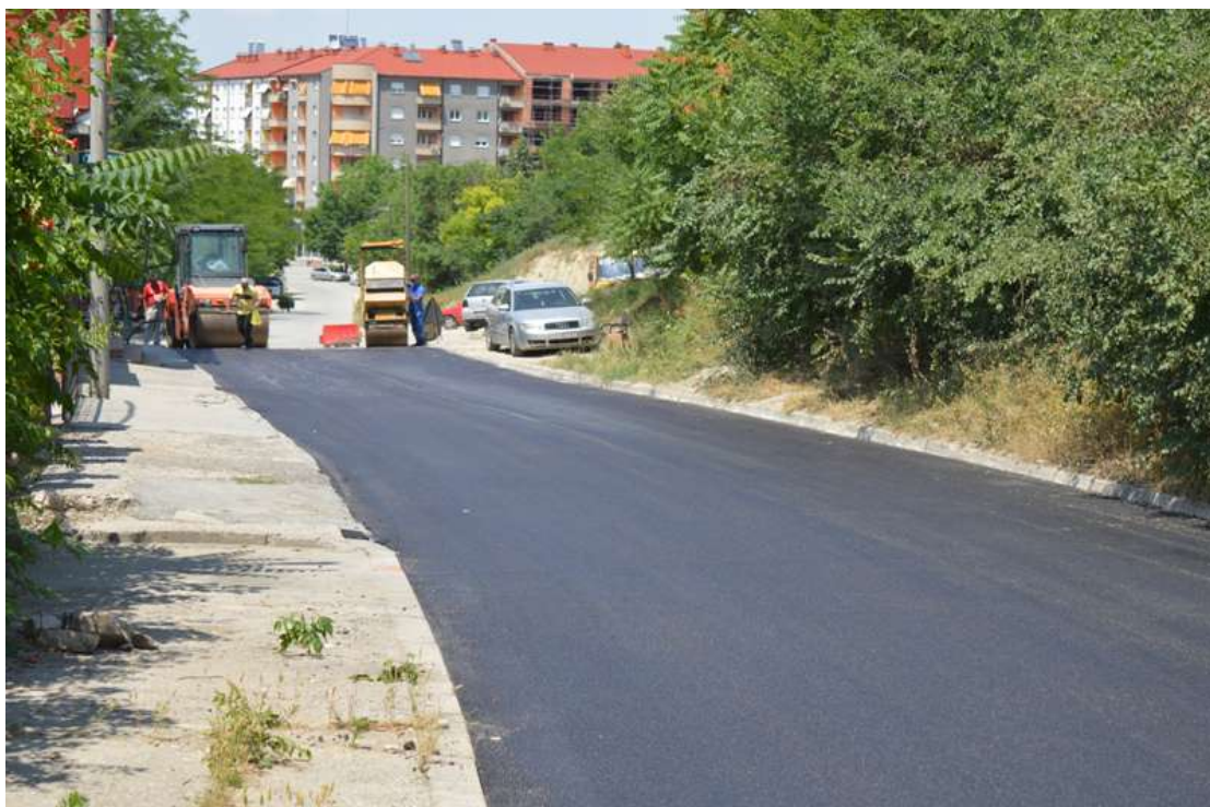
Асфалтирање на ул. Методи Цунов Цико