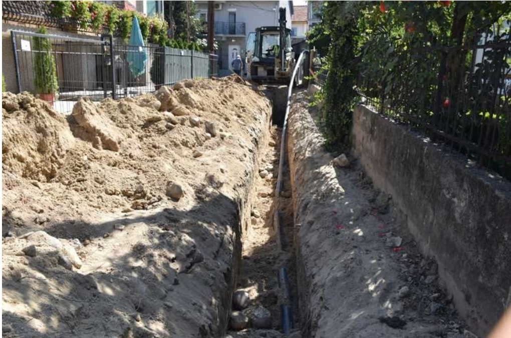
Реконструкција на водовод и канализација на ул. Даме Груев