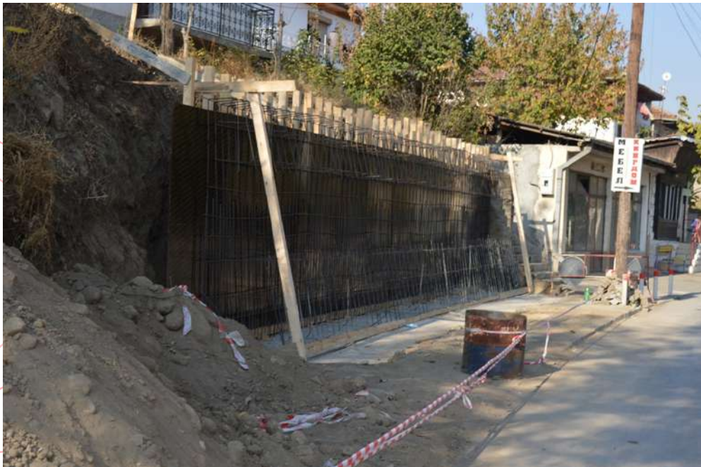
Потпорен ѕид на ул. Страшо Пинџур