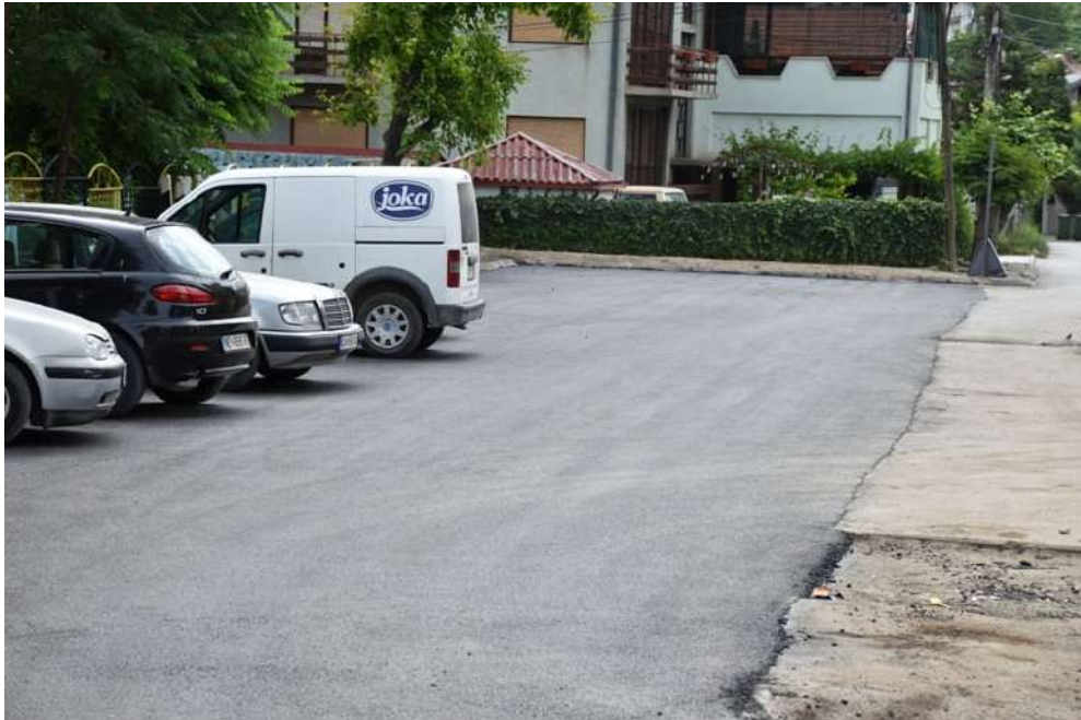
Асфалтрање паркинг на ул. Народни Херои