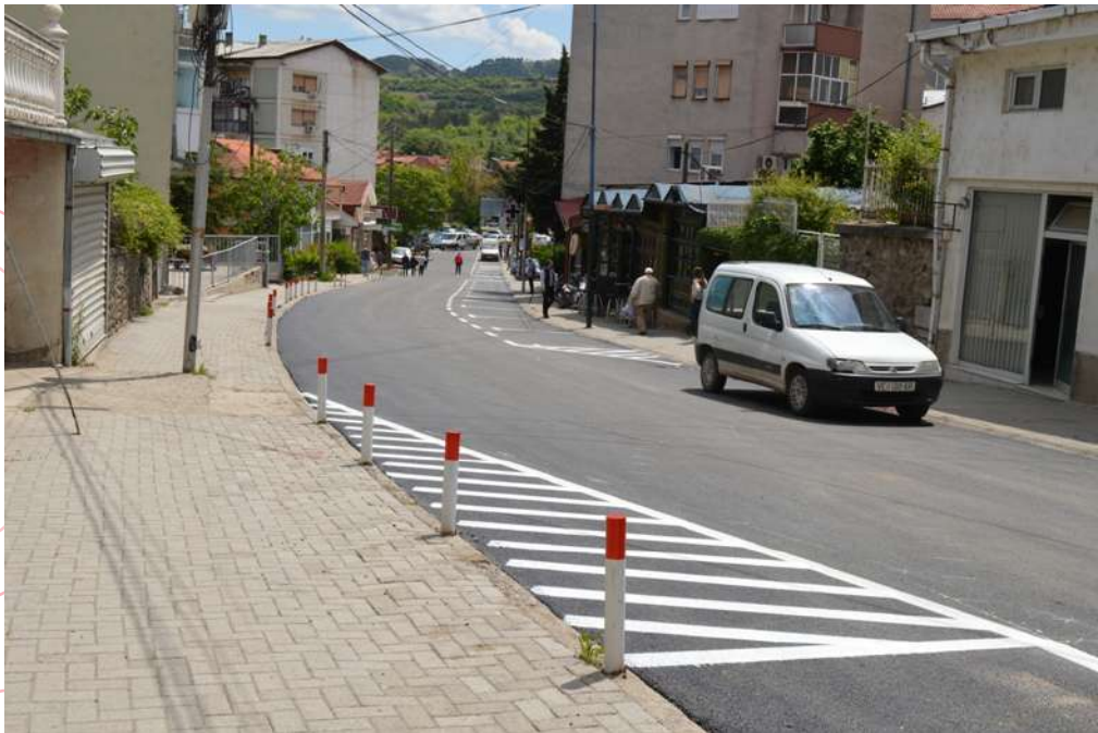
Асфалтирање на ул. Цано Поп Ристов