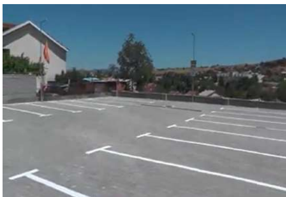
Нов паркинг простор кај стариот АН