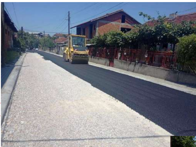
Асфалтирање на ул. Народна Младина