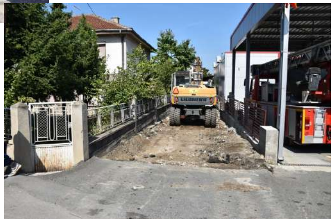
Бетонирање на уличка на Пожарната станица