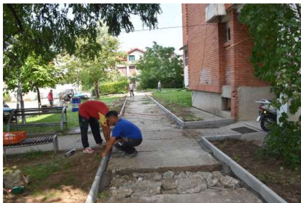
Поплучување на пристапни патеки