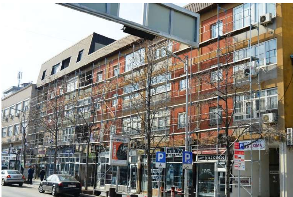
Реконструкција и обнова на фасади на ул Илинденска