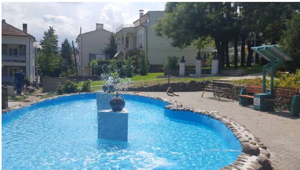
Реконструкција на фонтаната во паркот на револуцијата