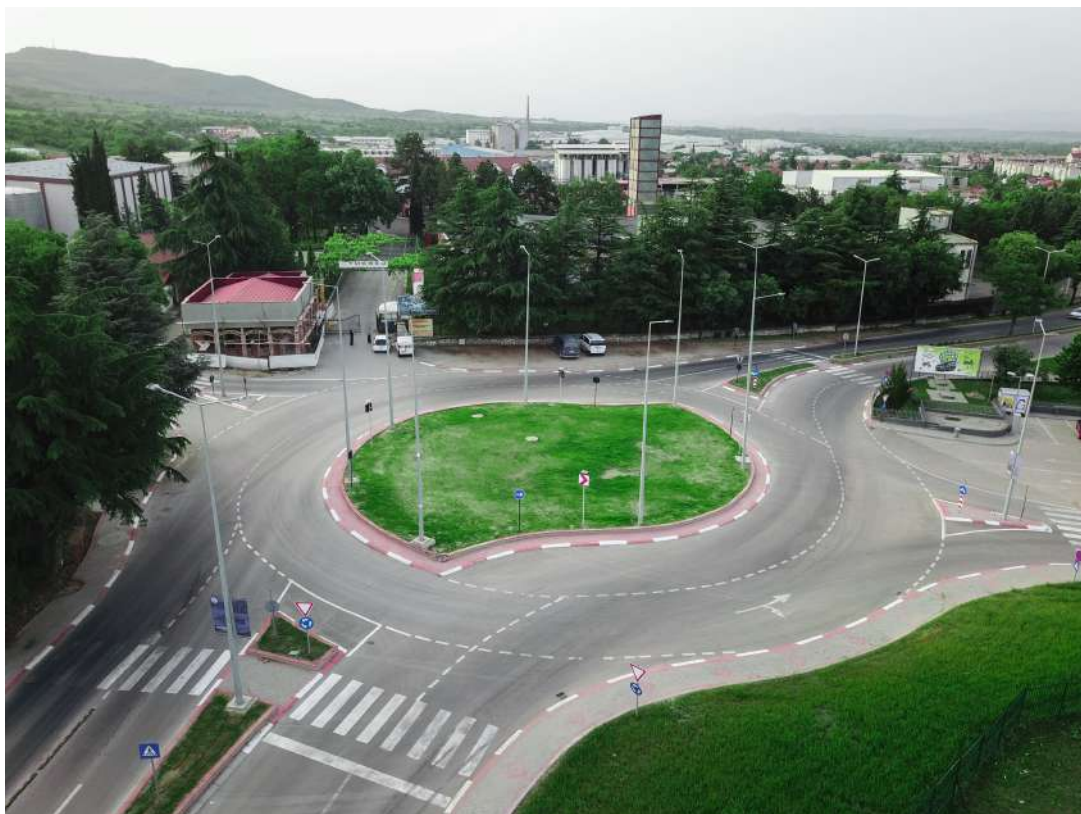
Нов кружен тек на Западен булевар