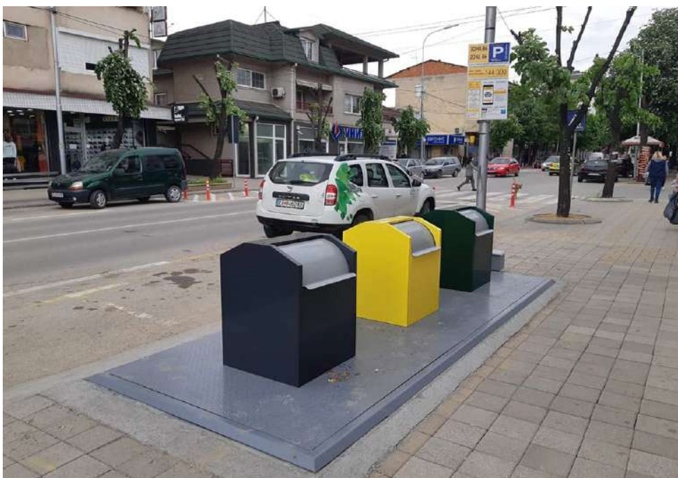
Подземни контејнери на неколку локации на ул. Илинденска