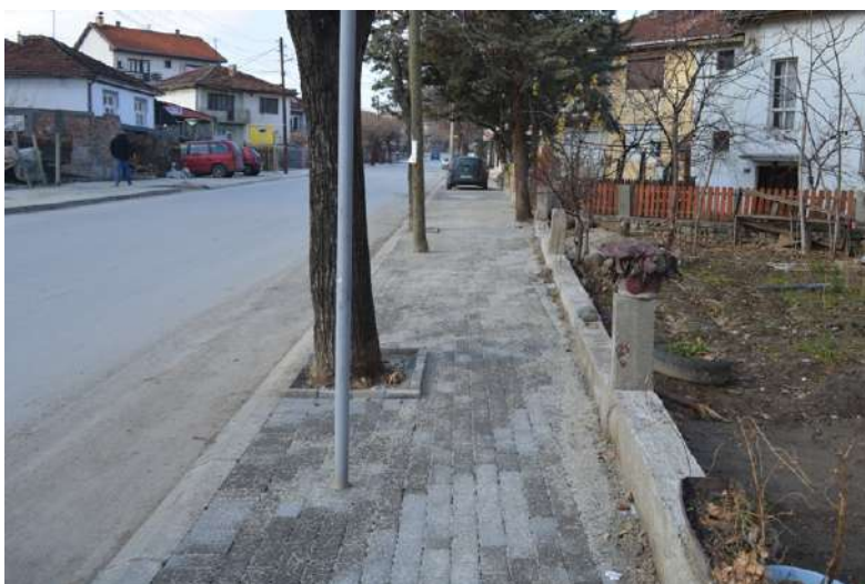
Поплочување тротоар на ул. Народен Фронт