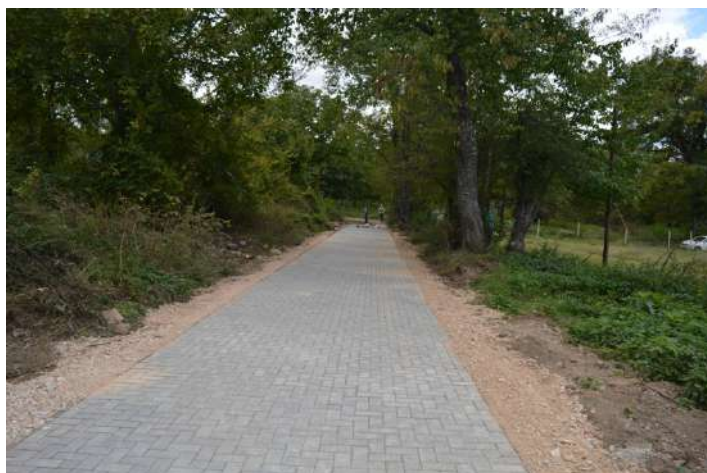
Поплочување во с. Чемерско