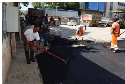
Реконструкција и проширување на паркинг на ул. Благој Крстиќ