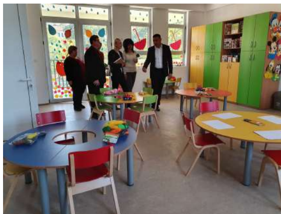
Опремување на занималните со дидактички материјали