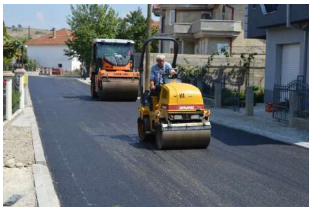
Пробивање и асфалтирање на крак на ул. Орце Николов