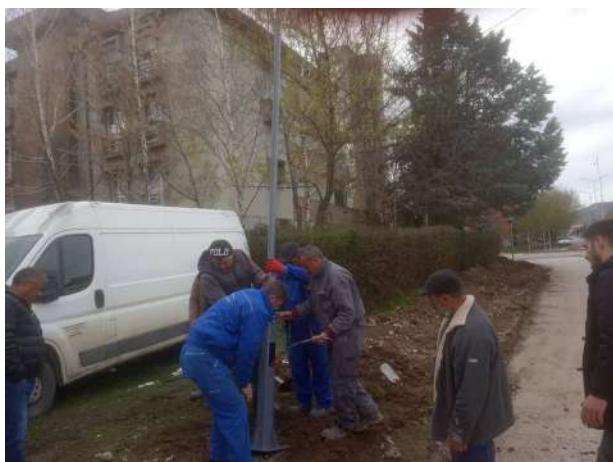
Поставување на ново улично осветлување