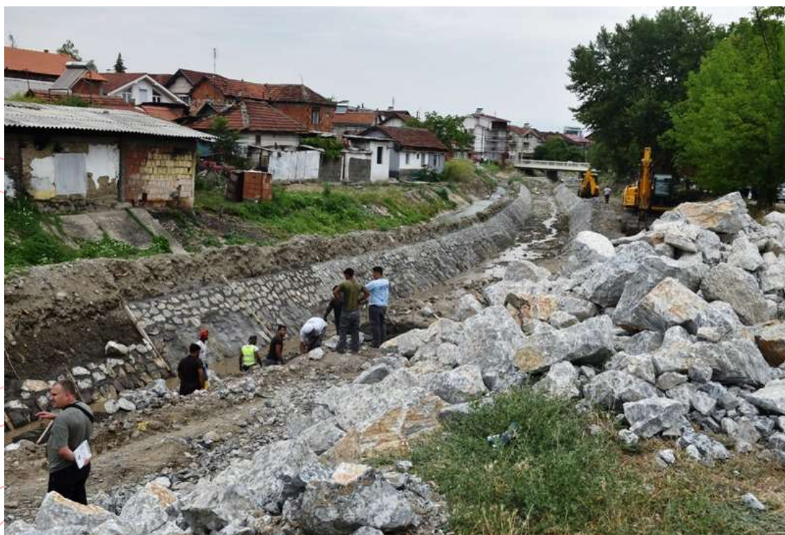
Доизградба на кејот на река Луда мара