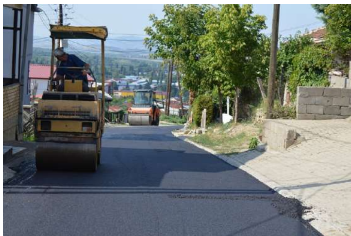
Асфалтирање на ул. Владимир Назор