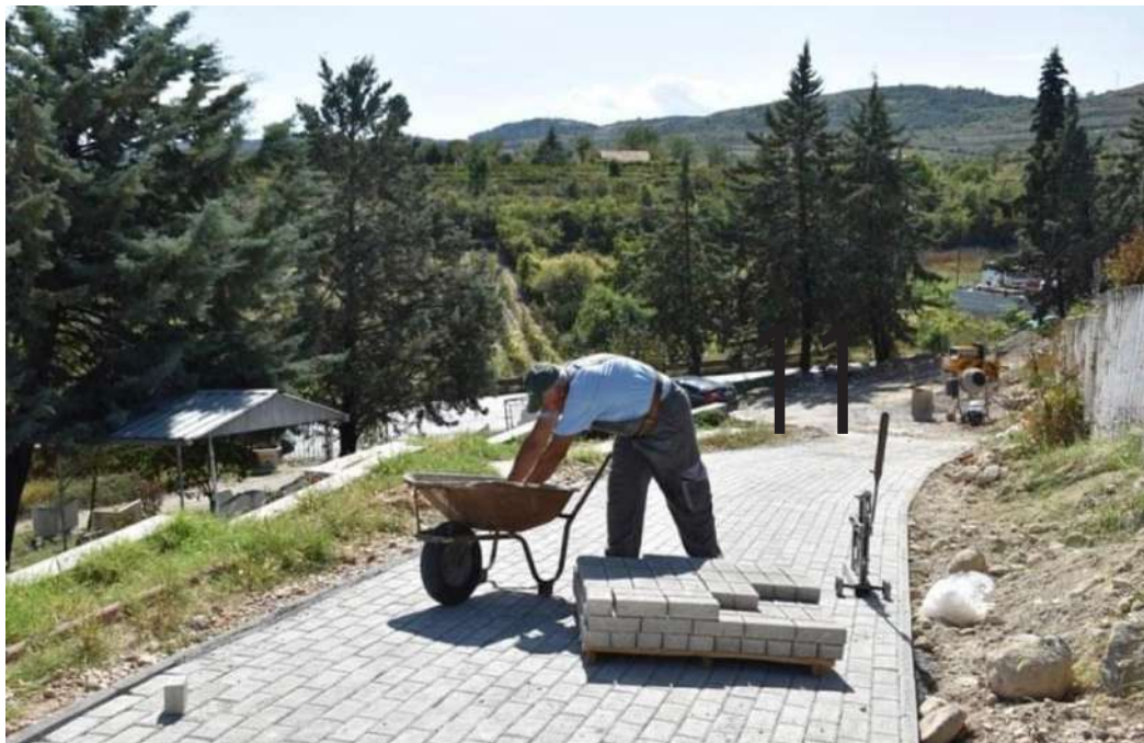
Пристапни патеки Градски гробишта