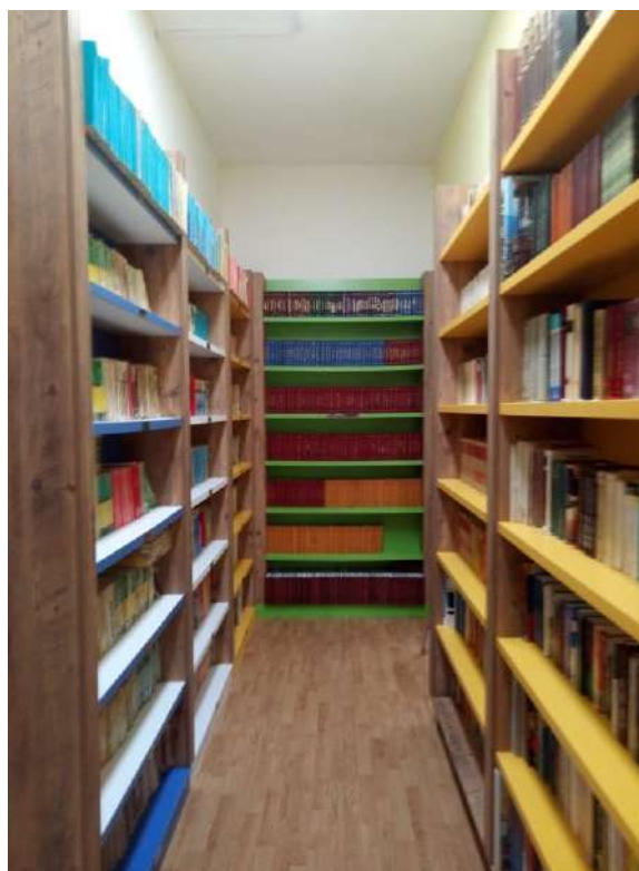
Нова библиотека во ООУ Тоде Хаџи Тефоф