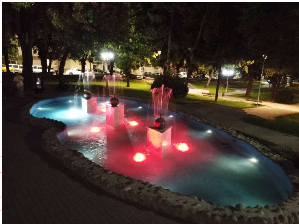
Фонтана Парк на револуцијата