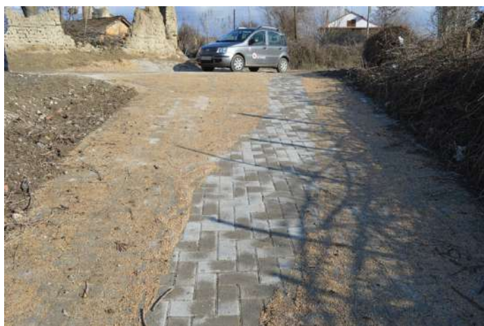
Поплочување во с. Ресава