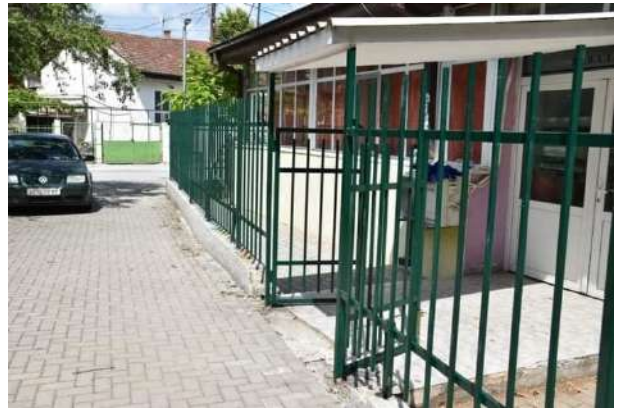
Оградување на детски градинки