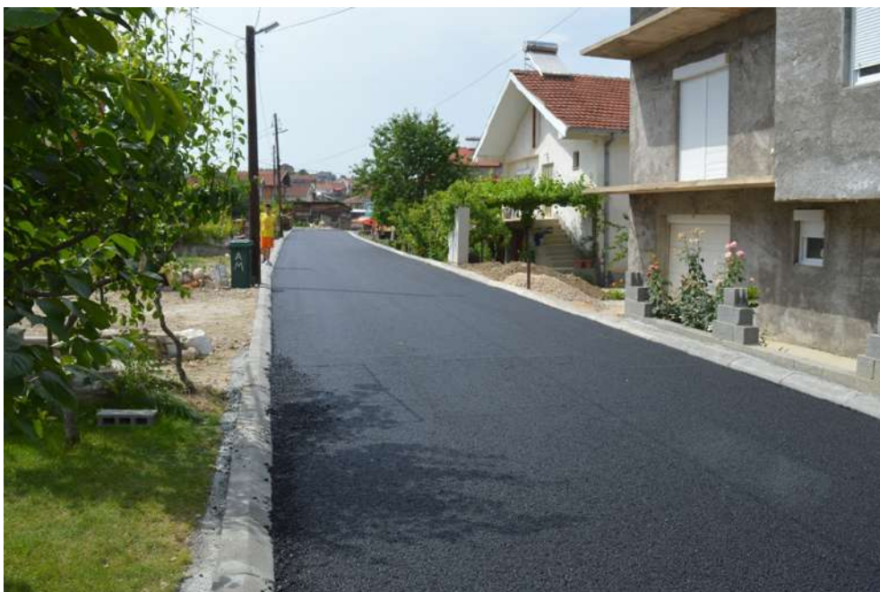
Асфалтирање на ул. Праведничка

Ваташа. Овој проект е во должина од 680 метри и е во вредност од 21 500 000, 00 денари. Проектот е финансиран од Биро за развој на Вардарски плански регион и буџет на Општина Кавадарци.