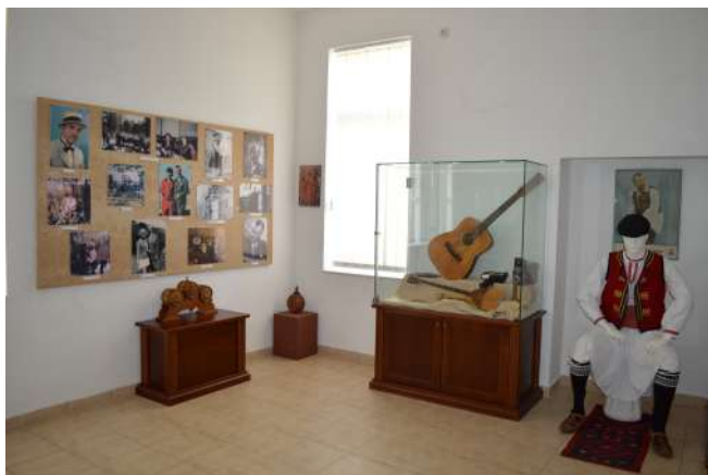
Спомен соба на Никола Бадев