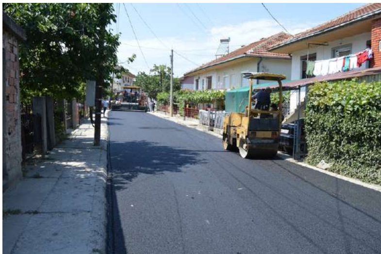
Асфалтрање на ул. Јован Планински