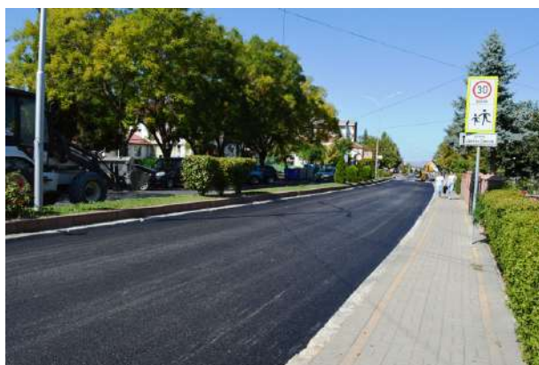
Асфалтирање на бул. Цветан Димов