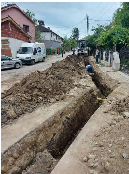
Реконструкција на водоводна и канализациона мрежа на ул. Стив Наумов