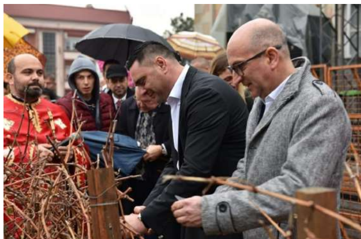
Св. Трифун 2020 год.