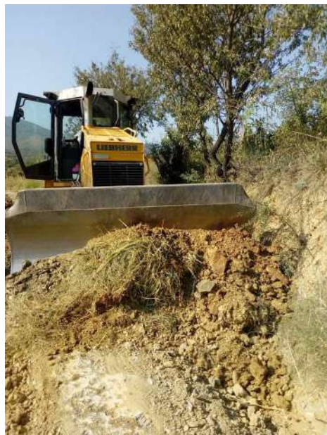
Санирање на полски патишта во с.Дреново