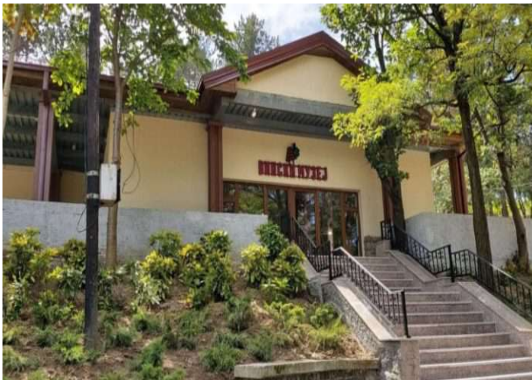
Регионален Вински музеј