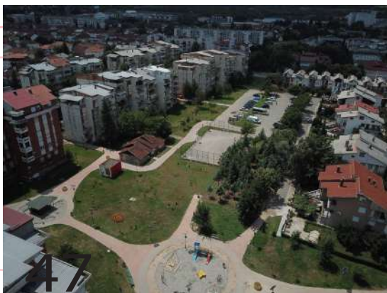
Хортикултурно позади Лепотици