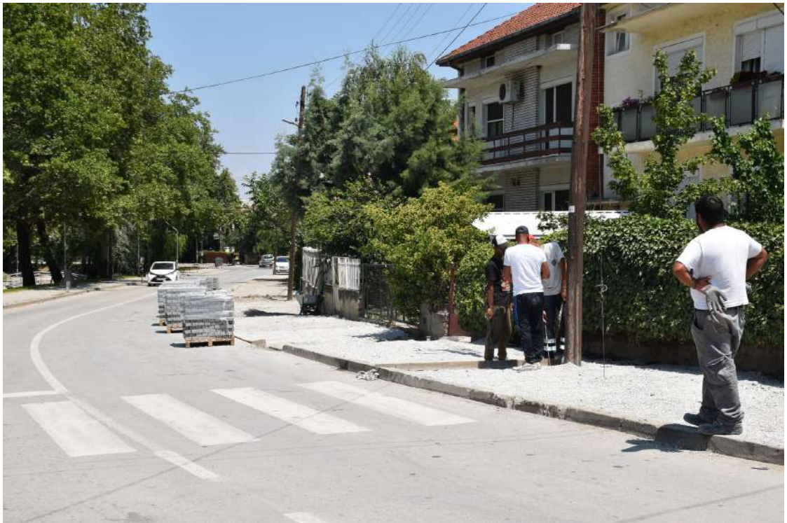
Поплочување на тротоар на ул. Киро Крстев