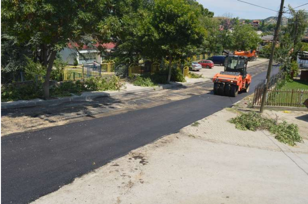
Асфалтрање на ул. Народни Херои