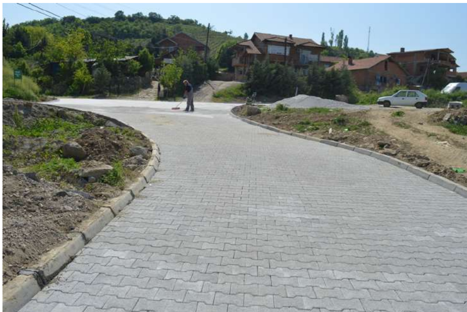
Поплочување на ул. 12 дугари