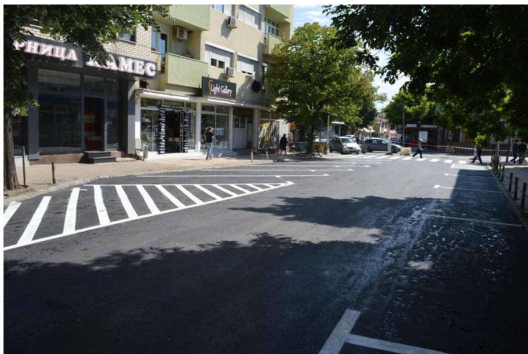
Реконструкција на ул. Пано Мударов и поставување на нови метални столбови