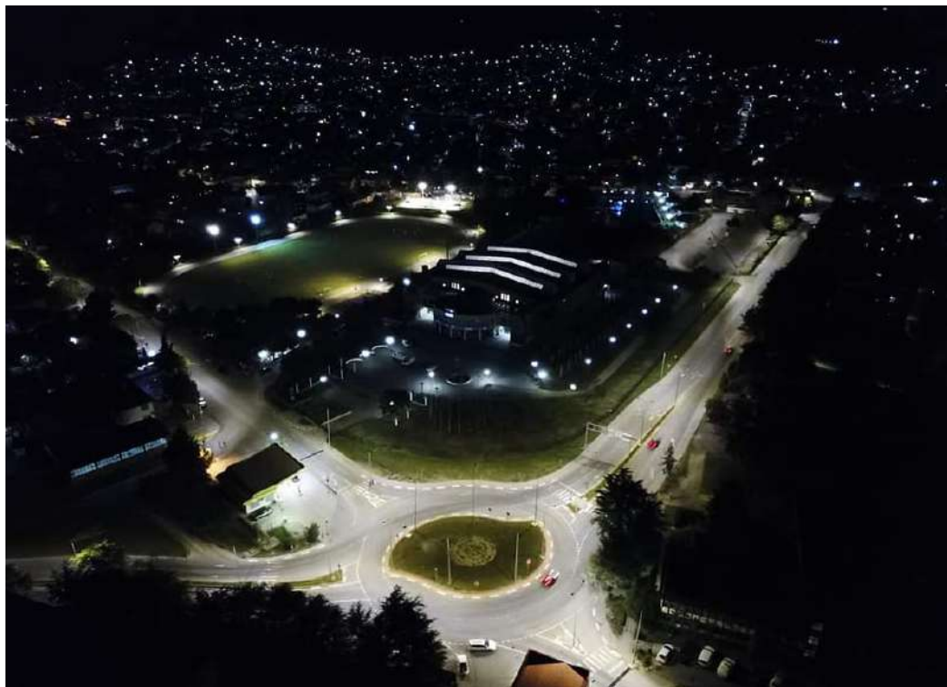
Дел од новото улично осветлување