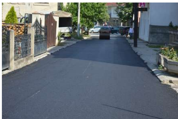
Асфалтирање на ул. 4 Јули