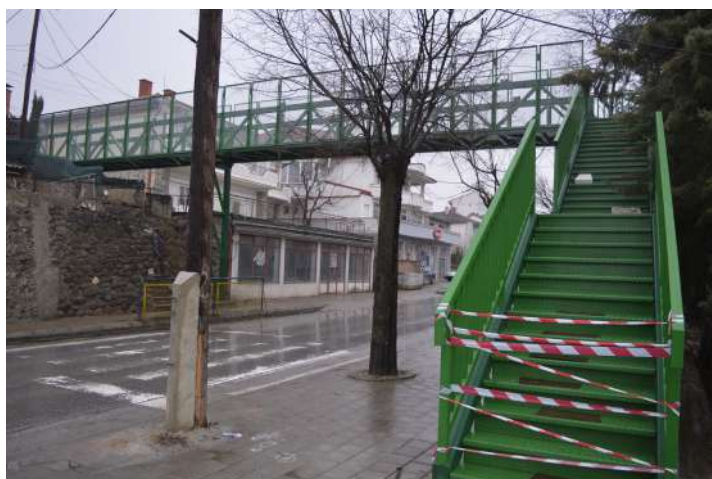
Мост за пешаци на ул.Шишка