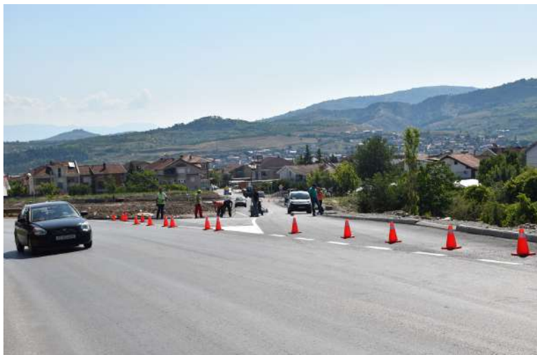
Пробивање на Западен Булевар