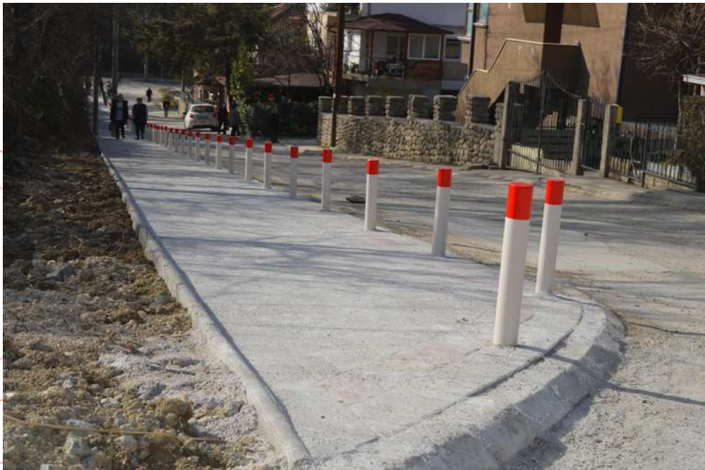
Поплочување на тротоар на ул. Рајко Жинзифов