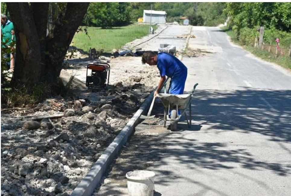
Пешачка патека с. Ваташа - Моклиште