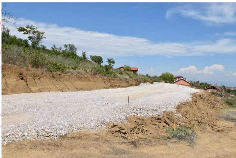
Пробивање и асфалтирање на ул. Црноречка