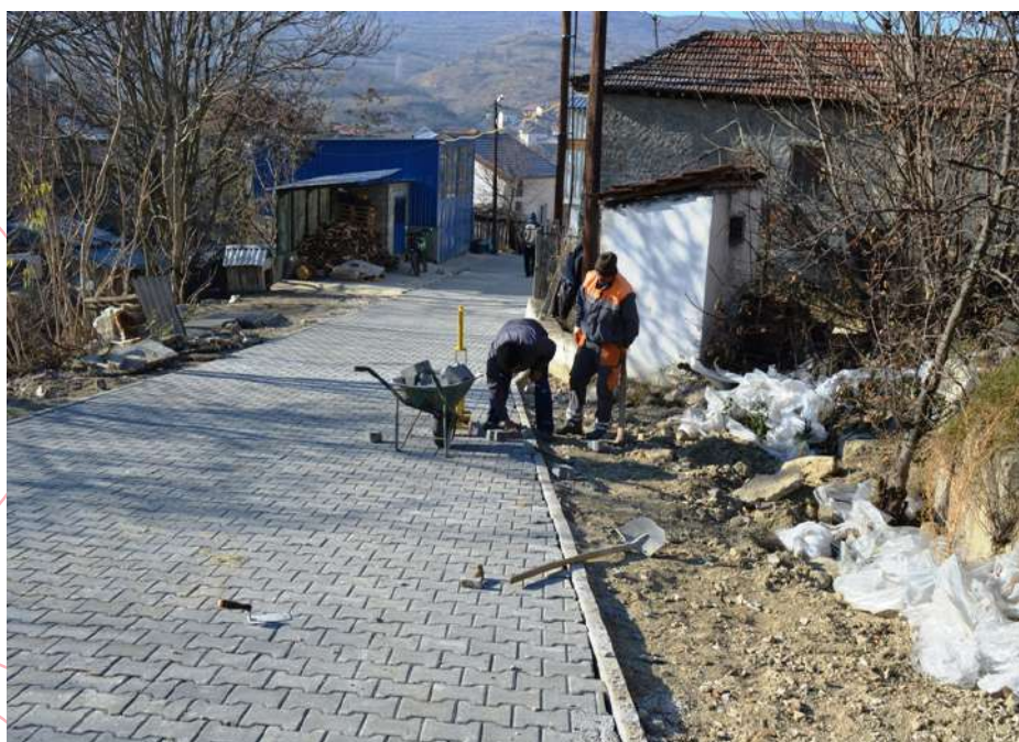
Поплочување на ул. Данко Давков