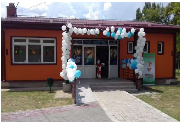
Нова детска градинка во с.Марена