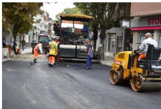
Асфалтирање на ул. Мито Хаџи-Василев Јасмин