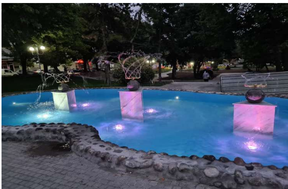
Реконструкција на фонтаната во паркот на револуцијата