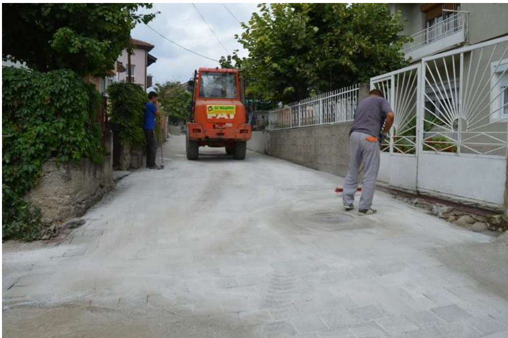
Реконструкција ул. Диме Поп Атанасов спој со ул. Пионерска