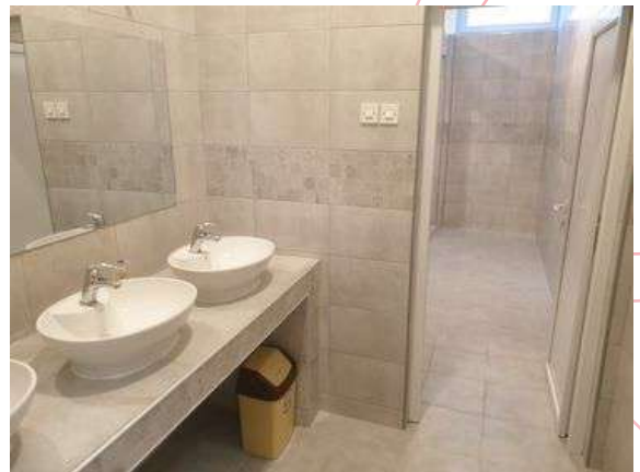
Реконструкција на санитарни јазли во СОЗШУ Ѓорче Петров