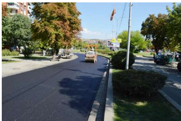
Асфалтирање на ул. Моша Пијаде