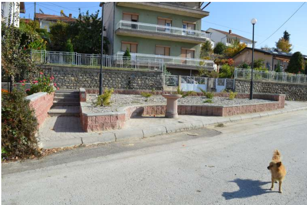
Партерно уредување на ул. Доне Попов