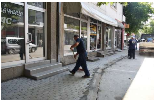
Поплочување на тротоар на ул. Цано Поп Ристов