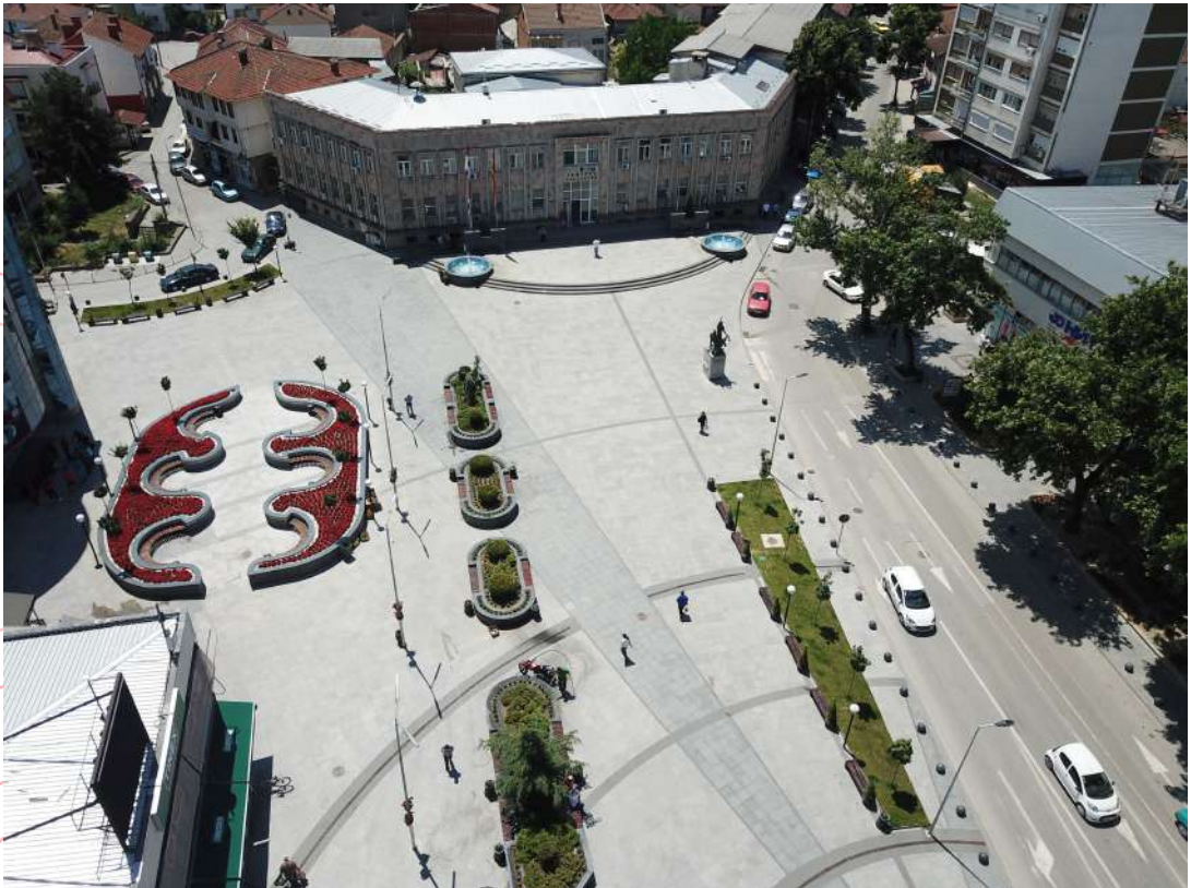
Реконструкција на Градски плоштад