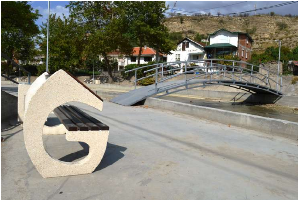
Kej во с. Ваташа