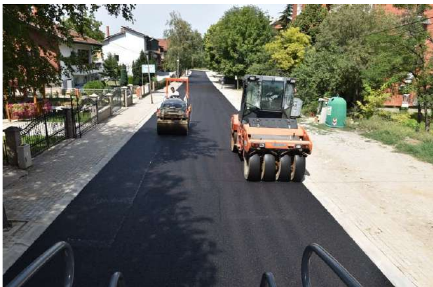
Асфалтирање на ул. Бел Камен