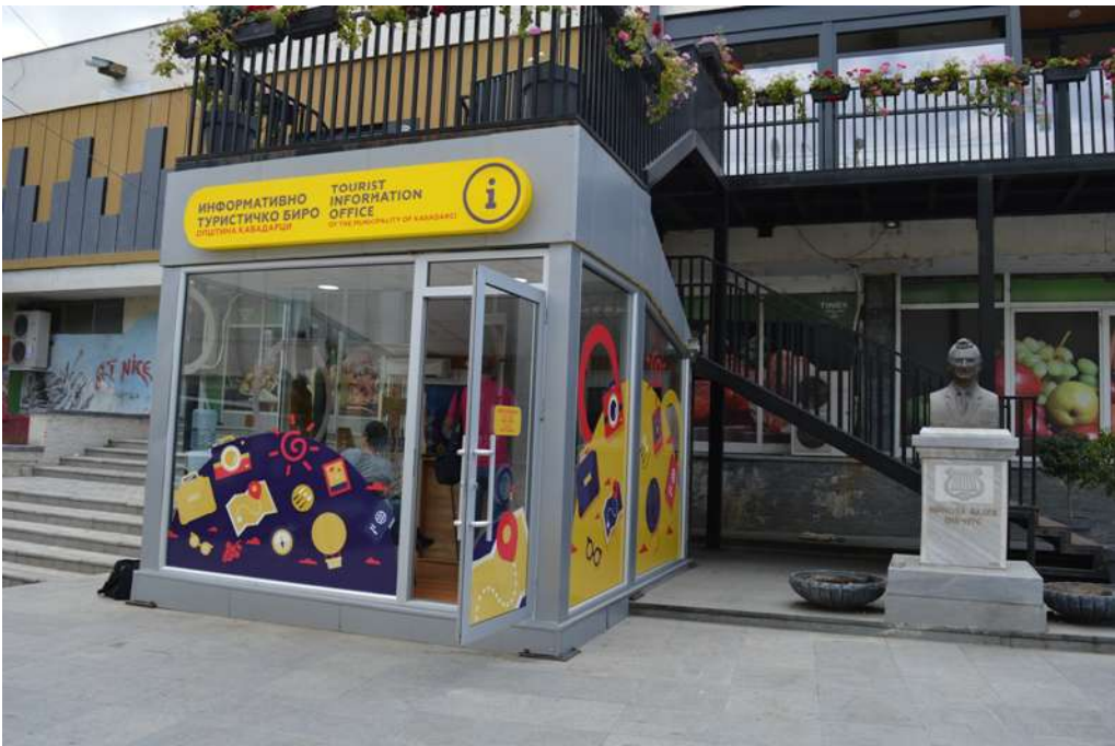
Туристичко информативно биро