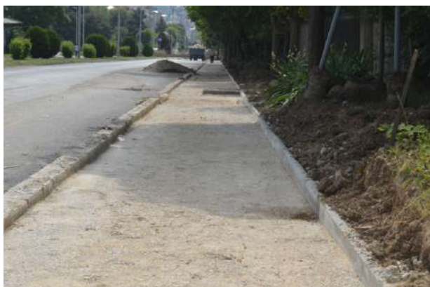
Поплочување на тротоар на ул. Моша Пијаде