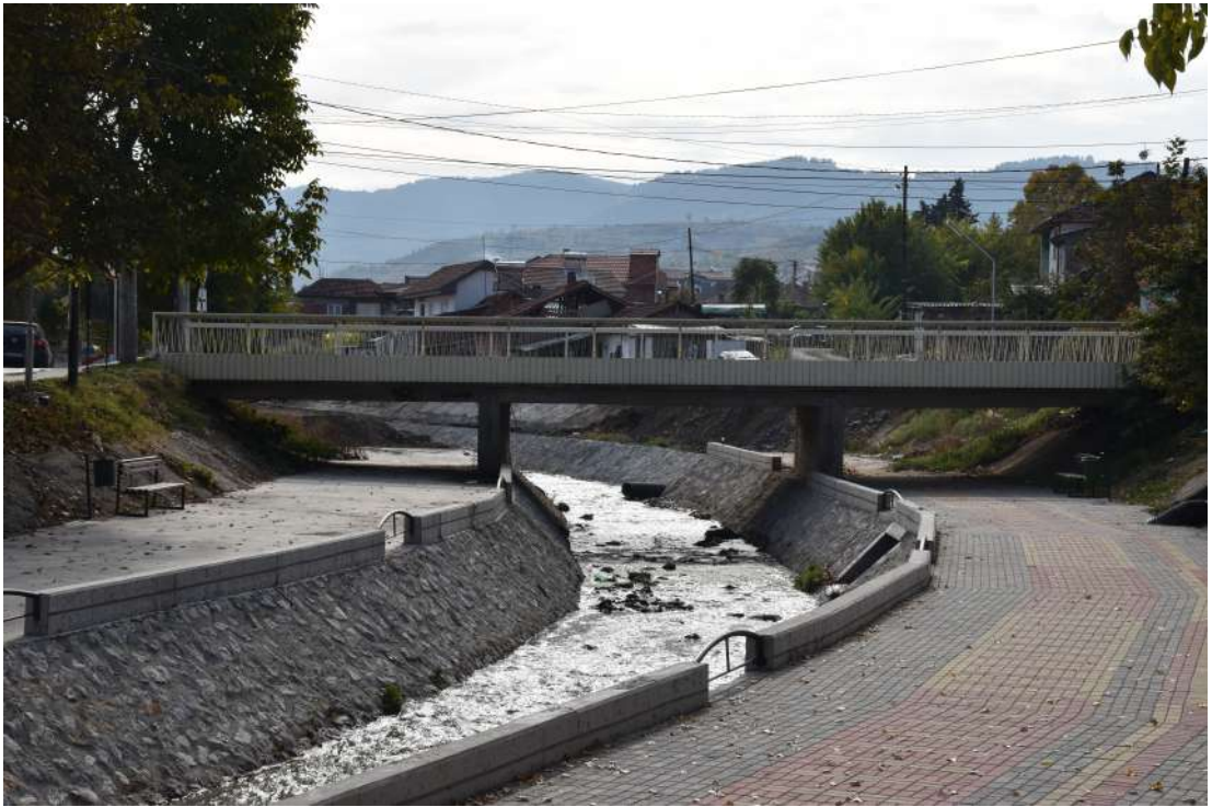
Реконструкција на мост Слога