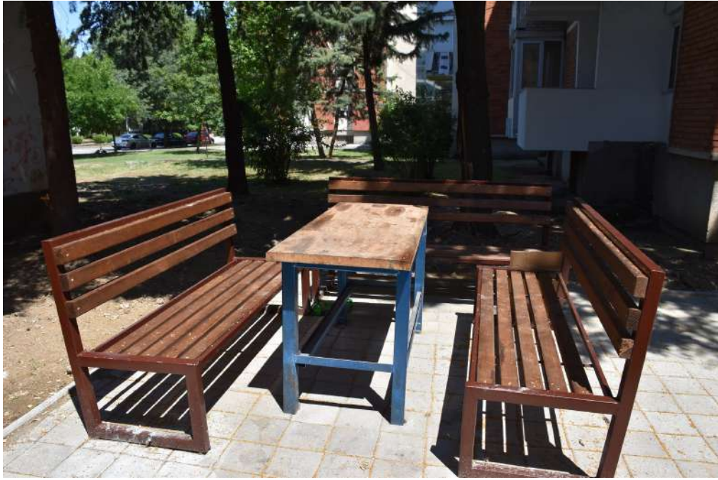
Поставена нова урбана опрема