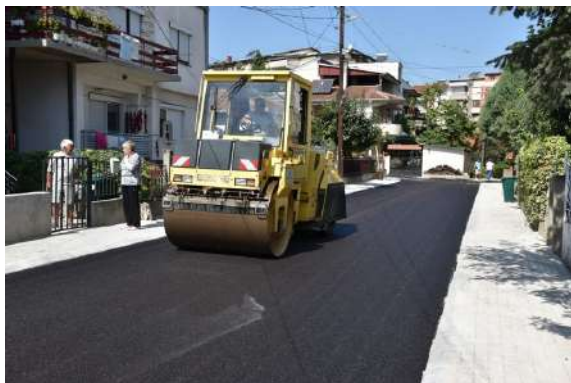
Асфалтирање на ул. Егејска