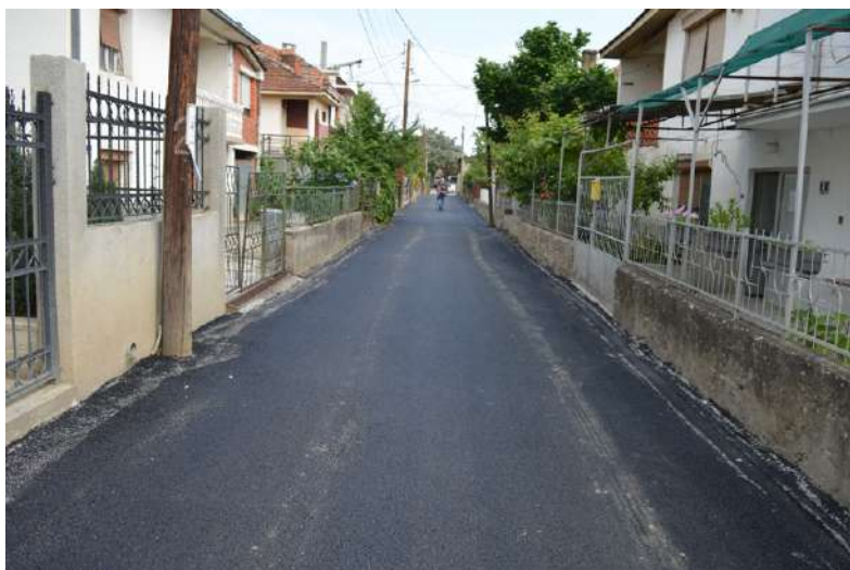
Асфалтрање на ул. Јане Сандански