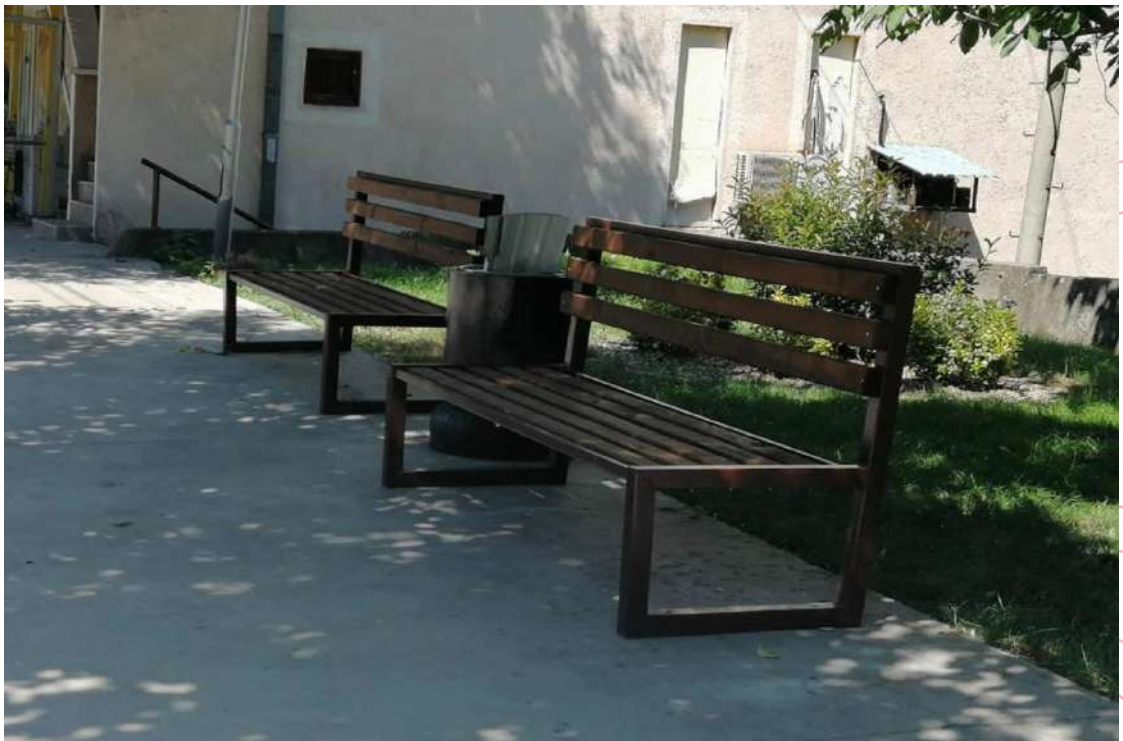
Поставување на нова урбана опрема