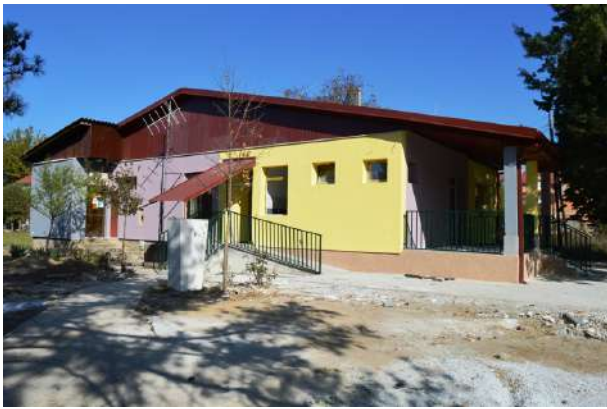
Изградба на нова детска градинка во с. Возарци