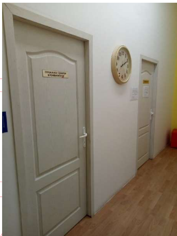
Нови простории за педагог и психолог во ООУ Тоде Хаџи Тефоф