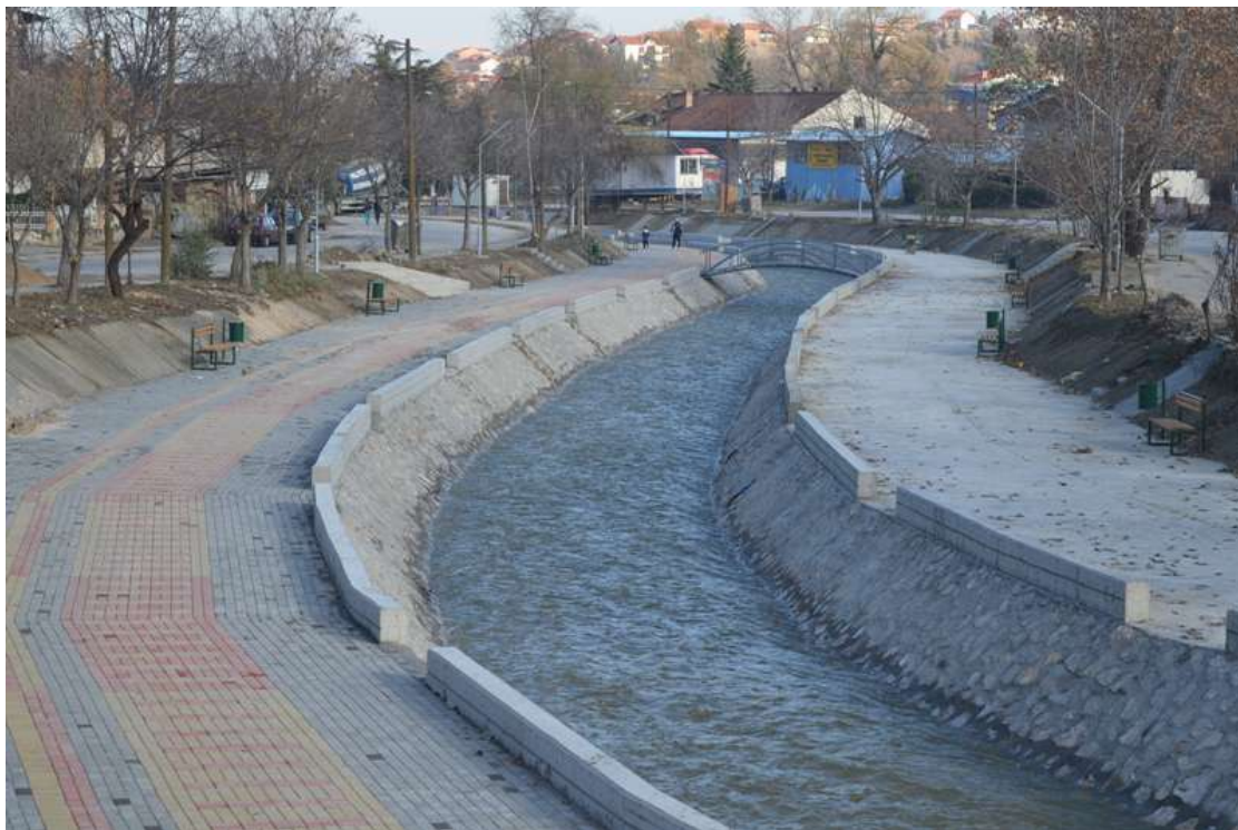
Изградба на кејот на реката Луда Мара