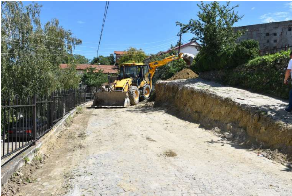
Потпорен ѕид на ул. Личка