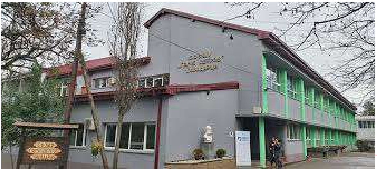
Реконструкција на фасада во СОЗШУ Ѓорче Петров